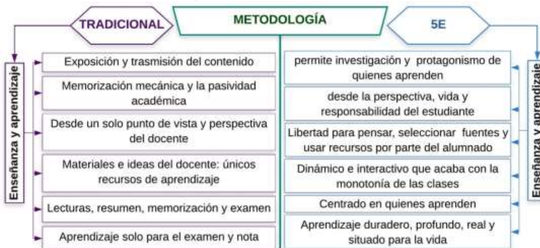
Figura 3 Diferencias entre la metodología tradicional y 5E

Finalmente, 5E permite la organización de la información y el interés por el aprendizaje: “son muy organizadas, sabes cómo estructurar tanta información, qué puede ser para el inicio y qué para después” (GF1). En ese sentido, es una metodología adaptable para abordar los diversos temas disciplinares: “este trabajo es bastante adaptable a cualquier tema” (GF2). Según Bybee et al. (2006), los filósofos como Sócrates y Herbart destacaron el interés, la curiosidad y aspectos subjetivos de los estudiantes para el aprendizaje, mientras que Ortega (2020) sugería la aplicación de 5E para el abordaje de diversos temas en cualquier disciplina curricular. Los resultados evidencian este aspecto transdisciplinar y secuencial de 5E para todas las áreas y niveles educacionales. Es decir, se puede usar en educación básica (obligatoria) y superior. La figura 3 muestra las diferencias entre la metodología de 5E y la tradicional.